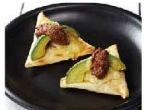
Tetelas chorizo / cream cheese / avocado "テテラ" チョリソを包んだ クレープチーズ焼き 2p 1100