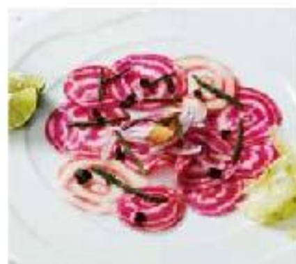
Tiradito de Vegetales today's vegetables / sea asparagus lime / red peppers 野菜のティラディート (カルパッチョ) 800