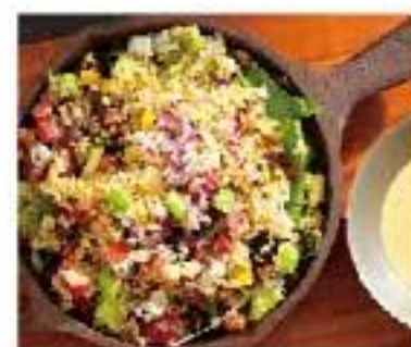
Ensalada Picada Toro crispy quinoa / lettuce cabbage / blue cheese tomato / olive TOROハウス チョップド サラダ 980