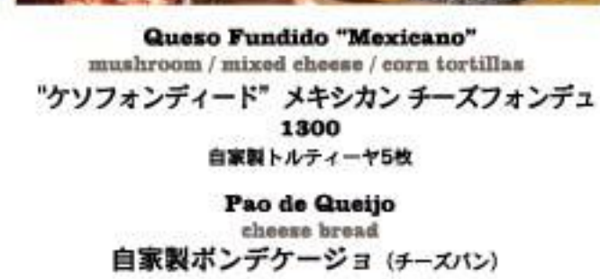
Pao de Queijo cheese bread 自家製ボンデケーキ (チーズパン) 4p 600 2p 300