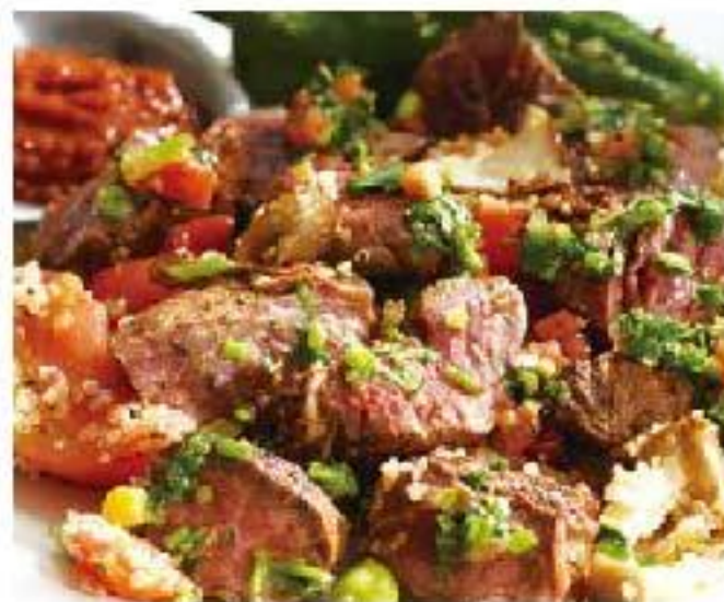
Carne Asada hanging beef / quinoa / jalapeno sauce mushroom / tomato / sweet long pepper "カルネ アサダ" ドライエイジングビーフと野菜のソテー 2800