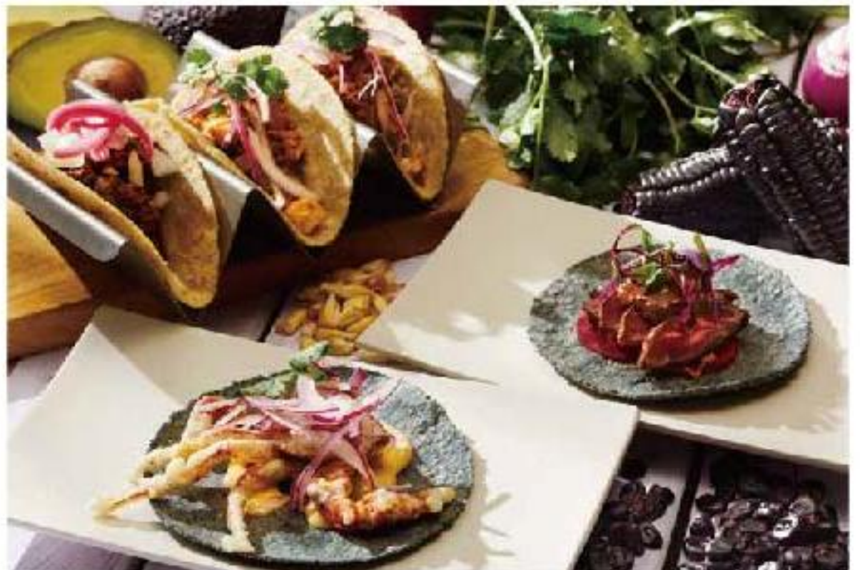
Puntas de Filete de Res beef / pickled onion ビーフとオニオンピクルスのタコス 400