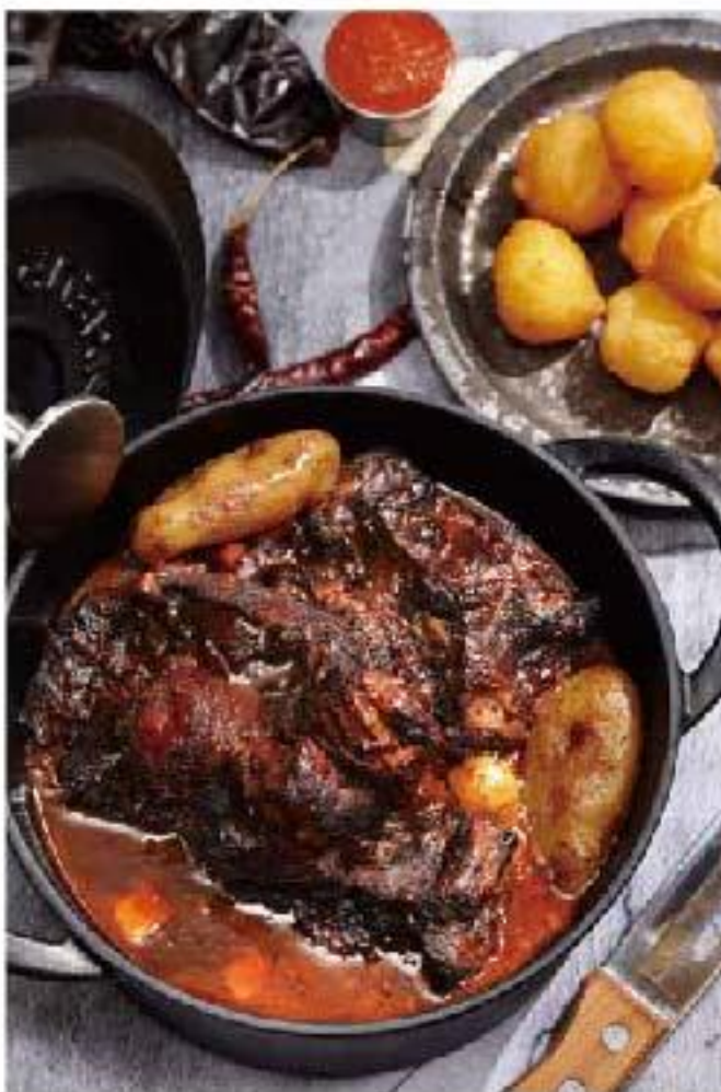
Rabata "Brasileno" grass fed beef / potatoes / tomato / cheese bread "ハバーダ" ブラジリアンビーフテールの煮込み ボンデケージョ添え 3200