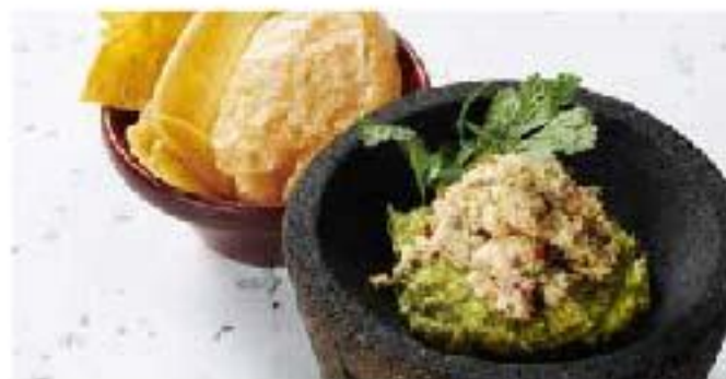
Guacamole con Pez Espada Ahumado smoked swordfish / avocado pickled chili / tortilla chips スモークカジキ&ワカモレ 1100