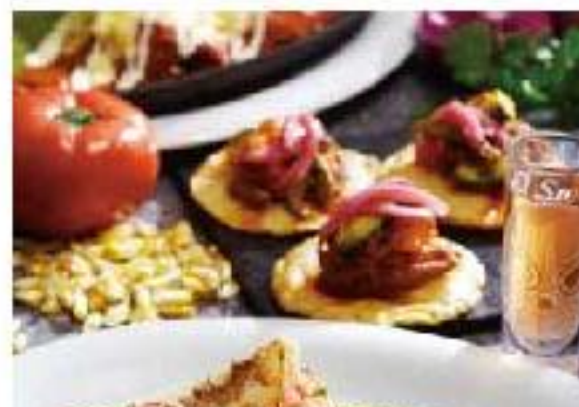
Quesadillas con Salsa Verde corn / cheese / tomato / onion / jalapeno "ケサディーヤ" ヴェルデソース 3p 1200