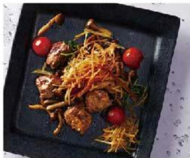
Lomo Saltado "Peruano" beef tenderloin / red onion / tomato / potatoes "ロモ サルタード" 牛肉とタマネギの シェリービネガーソテー 1600