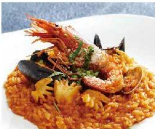
Arroz con Mariscos shrimp / squid / scallops / mussels / tomato / rice "マリスコス" 濃厚魚介のトマトリゾット 1800