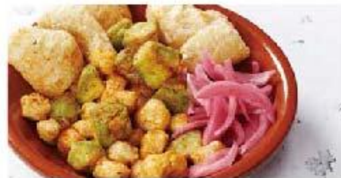
Chicharrón de Atun tuna / avocado マグロとアボカドのチチャロン 1100