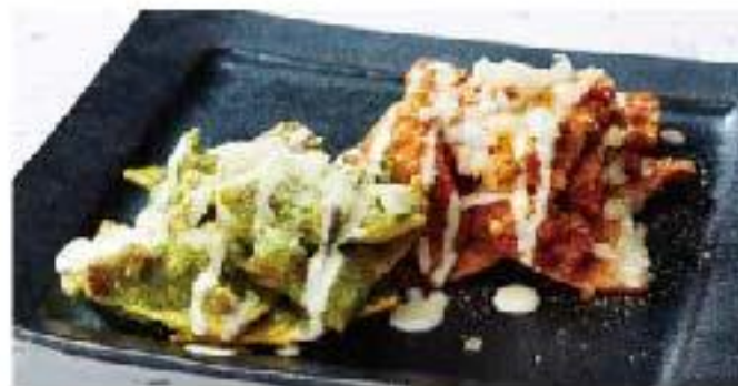
Chilaquiles tortilla chips / onion / cheese / chorizo / sour cream "チラキレス" メキシカンナチョス 1000