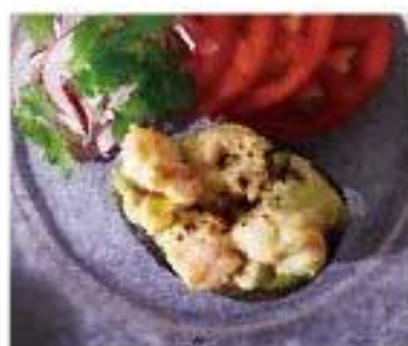
Ensalada de Camaron y Aguacate shrimp / avocado tomato / coriander 小海老とアボカドのサラダ 800