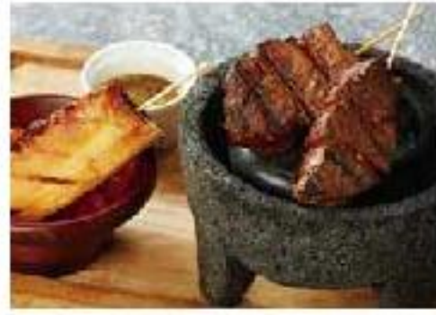
Anticuchos de Carne de Vaca beef / pineapple / black mint sourcee ビーフとローストパイナップルの アンティークーチョ(串焼き) 2本 1000