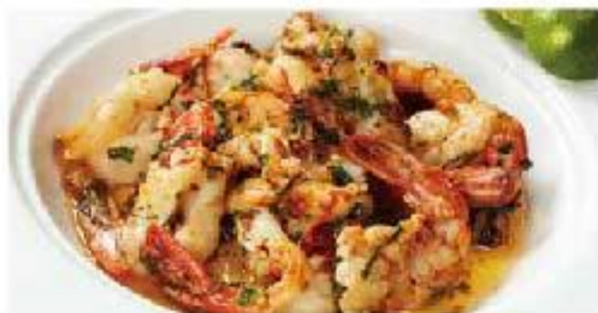
Camarones de Tequila shrimp / lime / tequila / garlic テキーラライムシュリンプ 10p 2500