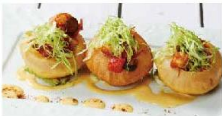
Infladitas de Mariscos shrimp / squid / scallops / vegetables / honey mustard "インフラディーダ" シーフードのアカブルコ 3p 900