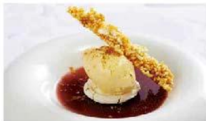
Helado de Canela y jalea de chicha morada cinnamon / purple corn / rice シナモンアイスクリーム チチャモラーダ(紫トウモロコシ)ゼリー添え 600