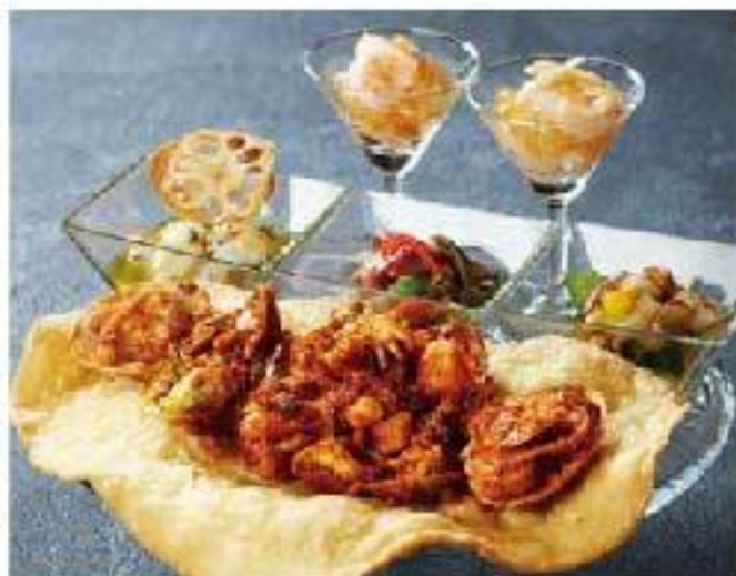
Torre de Mariscos seasonal seafood シーフードタワー 3800 3種のセヴィーチェと魚介のスパイシーソテー