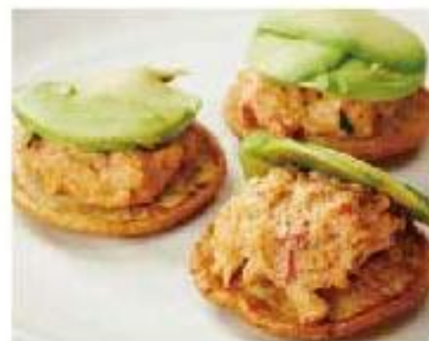
Bocols snow crab / avocado / chipotle pepper "ボッコル" スワイガニとアボカドのカナッペ 3p 900