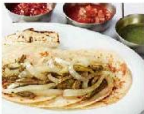
Placa de Tacos Vegetarianos cactus / onion / cheese サボテンとオニオン 焼きチーズのタコスプレート 4p 1200