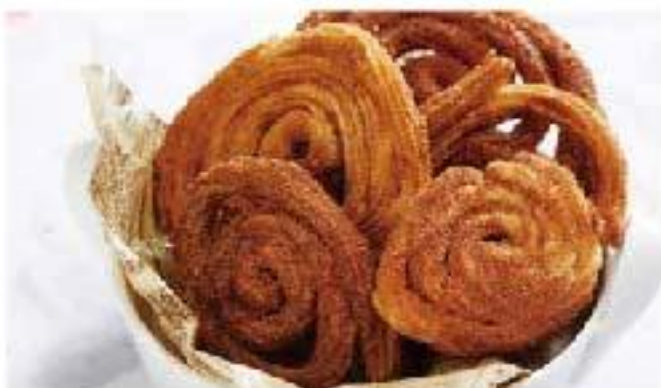
Churro cinnamon / sugar / flour / egg 揚げたてチュロス 4p 680