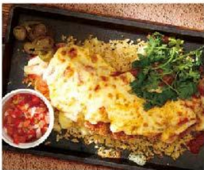
Rejjano "Brasileno" pork / cheese / coriander / rice "レジャーノ" ブラジリアンポークカツレツ 1800