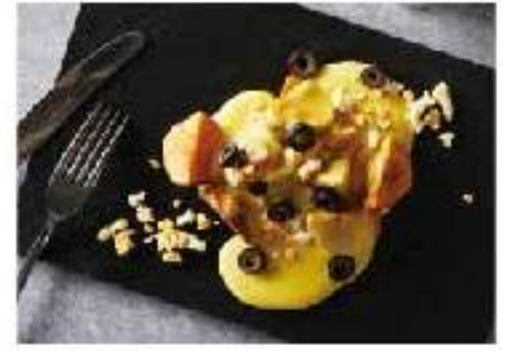
Papa a la Huancaína potatoes / cheese sauce "ハバラワンカイナ" ポテト&チーズ 800