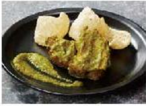
Entomatado de Cerdo spareribs / green tomato / onion / garlic スペアリブとチチャロンの トマトヴェルデ 1200