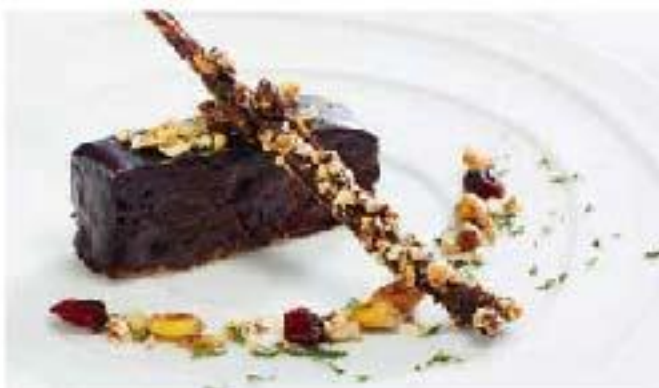
Pastel de Chocolate chocolate / dried corn / egg / flour condensed milk / cream / evaporated milk メキシカンチョコレートケーキ 750