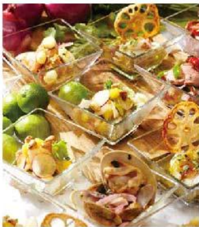
Ceviche de Mariscos shrimp / squid / scallops / lime シーフードとチョコクロの セヴィーチェ 680