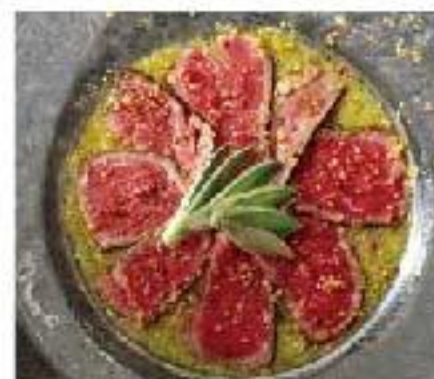
Tiradito de Carne Wagyu tomatillo sauce / onion 和牛のティラディード (カルパッチョ) 1300