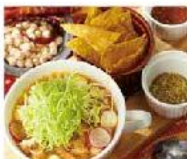
Sopa Pozole chicken / pork garbanzo / corn / lettuce "ポソレ" たっぷり野菜の メキシカンスープ 680 メキシコではタコスとともに愛される定番スープ ライム・オレガノ・チリをお好みで お召し上がりください。