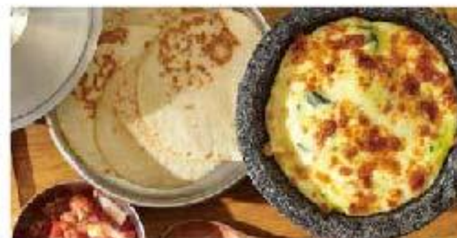
Queso Fundido "Mexicano" mushroom / mixed cheese / corn tortillas "ケソフォンディード" メキシカン チーズフォンデュ 1300 自家製トルティーヤ5枚