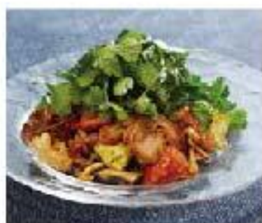
Ensalada de Pollo y Cilantro chicken / mushroom coriander / balsamic vinegar チキンときのこのソテー "バクチー" サラダ 1100