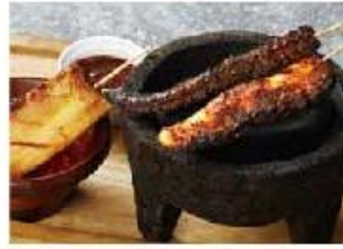
Anticuchos de Pulpo octopus / pineapple / horrachos sourcee タコとローストパイナップルの アンティークーチョ(串焼き) 2本 1100