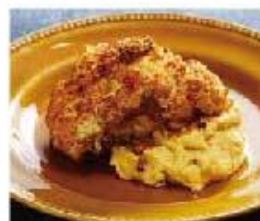
Coliflor frita y Hummus cauliflower / hummus olive oil / garlic まるごとフライド カリフラワー&フムス 1000