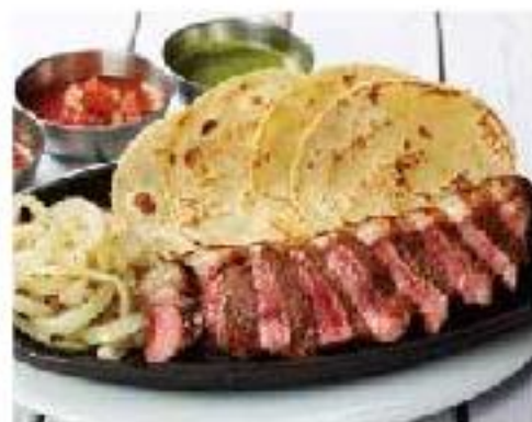
Placa de Tacos de Carne de Vaca (Picanha) beef (rump cap) / onion ビーフステーキタコスプレート 4p 1600